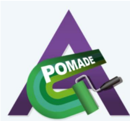
レインポマード 塗料データ