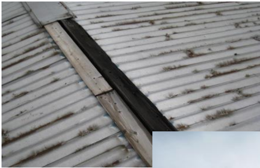
屋根・外壁の欠落

そもそも、工場で発生する雨漏りの原因に関して、お伝えいたします。 工場の屋根は、紫外線や、雨風の影響を受けやすいです。 そのため、『屋根』『コーキング』『ボルト』などの劣化が発生しやすいです。 これらの部分の劣化が進むと、錆やひび割れなどが発生して雨漏りの原因へとつながります。